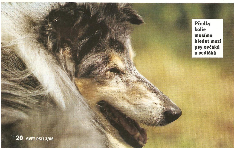
Předky kolie musíme hledat mezi psy ovčáckými a sedláckými