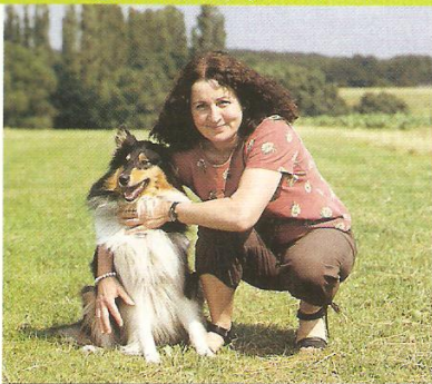
Kolie jsou vysloveně inteligentním plemenem psů