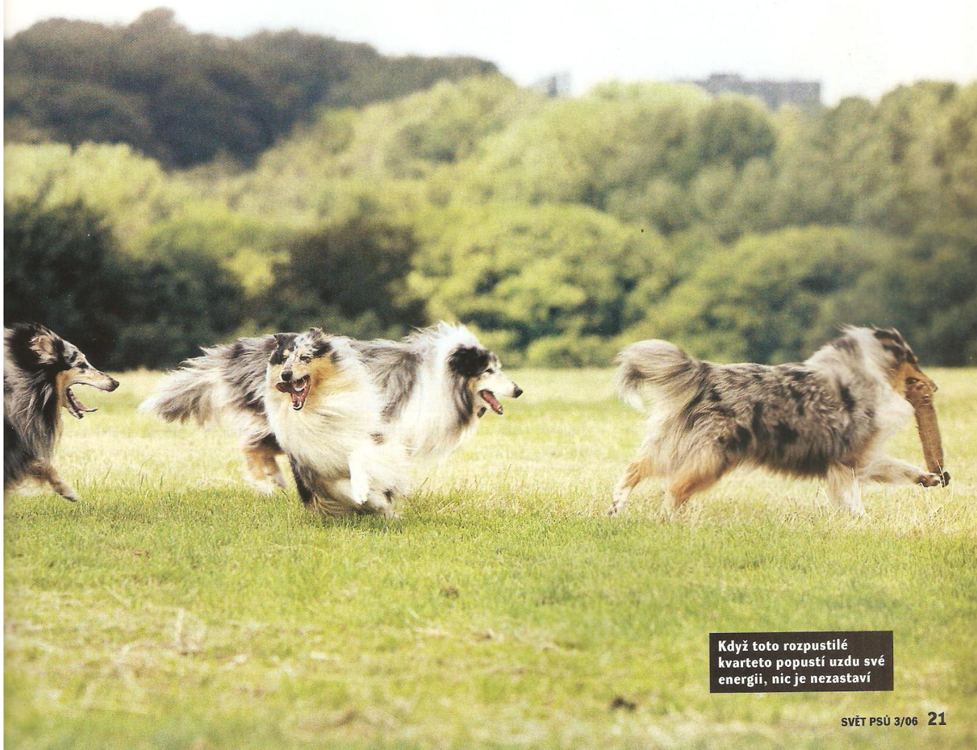
Když toto rozpustilé kvarteto popustí uzdu své energii, nic je nezastaví

Kolie jsou vysloveně oblíbené - a to neplatí jen v Evropě. Velké množství horlivých příznivců mají i ve Spojených státech. Koneckonců i tam je historie chovu kolyí zajímavá. Poté, co se chov kolyí po dlouhá