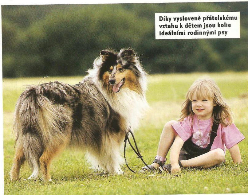
Díky vysloveně přátelskému vztahu k dětem jsou kolie ideálními rodinnými psy

Psy postačí jednou týdně důkladně vykartáčovat a srst učešat hřebeny, které mají otáčecí zuby. Otáčení zubů brání tomu, aby hřeben v srsti uvízl. Příliš intenzivní a častá péče je nevhodná, protože můžete vytrhat podsadu. A to se nepříznivě projeví na objemu srsti. Stačí, když dlouhosrstou kolii každých 14 dní důkladně vykartáčujete a dbáte na to, aby jí srst nezplstnatěla, k čemuž mívá srst někdy sklony za ušima nebo na březích. Dlouhá srst svádí řadu majitelů psů k tomu, aby svá zvířata kartáčovali příliš často. Výsledek je jasný: vyčesané kolie s lesklou, ale skromnou srstí. Huňatá podsada, která byla u těchto psů vykartáčována, poskytuje psům navíc důležitou ochranu proti chladu a vlhkost, a proto ji psi potřebují a musí jim zůstat zachována. Komu by se však zdála příliš náročná i tato péče, měl by se raději rozhodnout pro některou z krátkosrstých kolíí. Ty samozřejmě existují také.