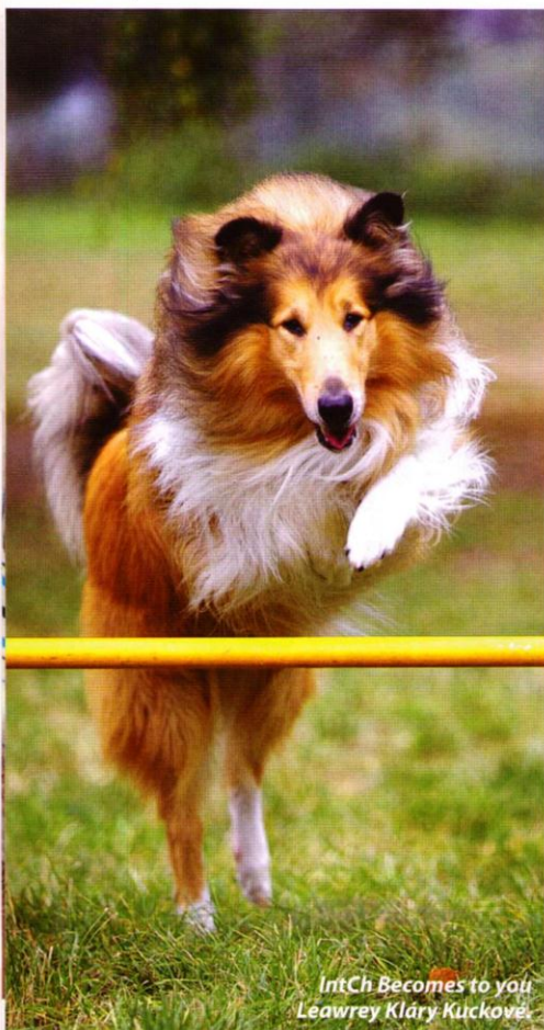
IntCh Becomes to you Leawrey Kláry Kuckové

ného společníka, milujícího všechny členy rodiny, včetně dětí. Prioritou pro kolii je kontakt se svým páнем. Nejedna majitel dlouhosrstky dříve nebo později bude toužit po nějaké společné aktivitě. Kolie jsou velmi snadno ovladatelné a mimořádně citlivé plemeno, předurčené k dogdancingu a při vhodné